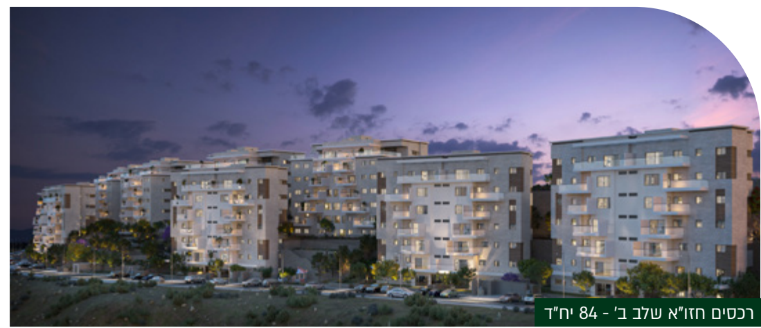
רכסים חזו"א שלב ב' - 84 יח"ד