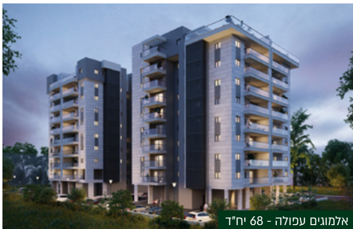
אלמוגים עפולה - 68 יח"ד