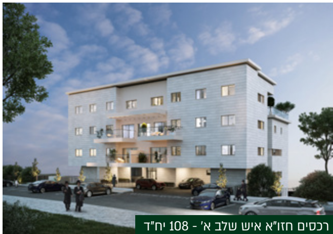
רכסים חזו"א איש שלב א' - 108 יח"ד