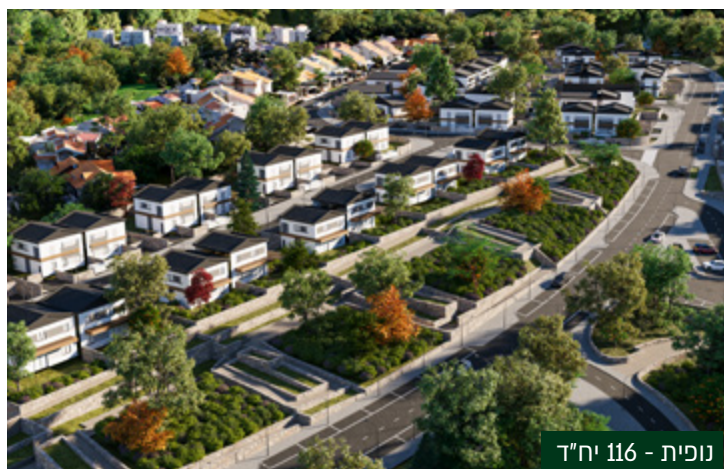
נפית - 116 יח"ד