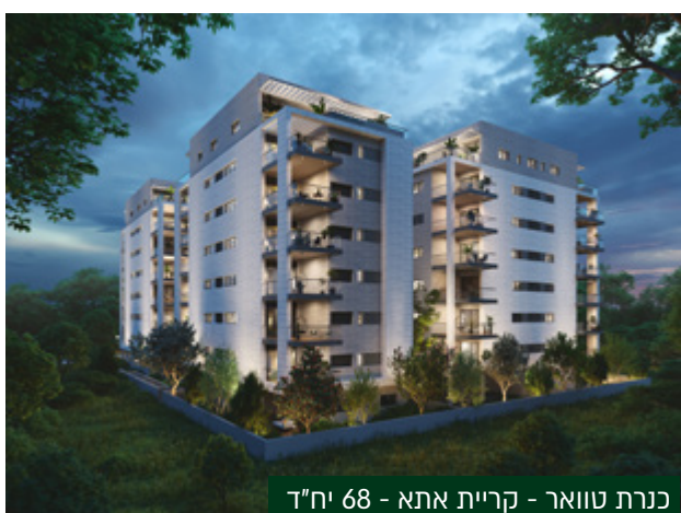
כנרת טוואר - קריית אתא - 68 יח"ד