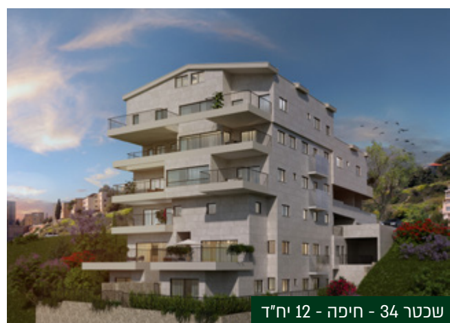
שכטר 34 - חיפה - 12 יח"ד