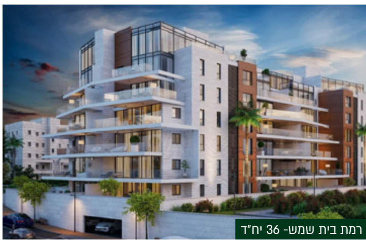
רמת בית שמש - 36 יח"ד