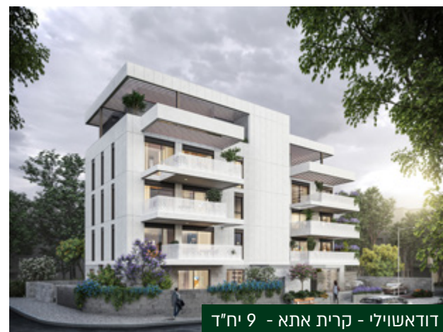
דודאשוילי - קרית אתא - 9 יח"ד