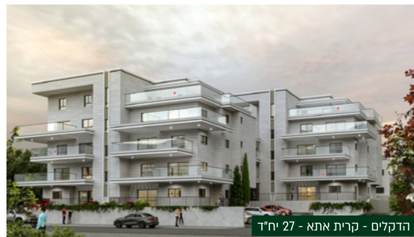
הדקלים - קרית אתא - 27 יח"ד