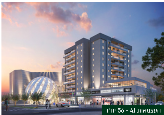
העצמאות 41 - 56 יח"ד