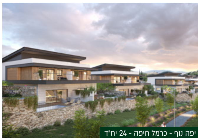
יפה נוף - כרמל חיפה - 24 יח"ד