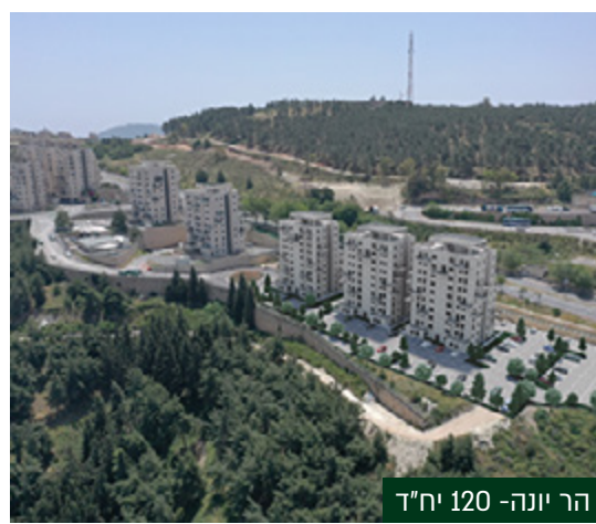
הר יונה - 120 יח"ד