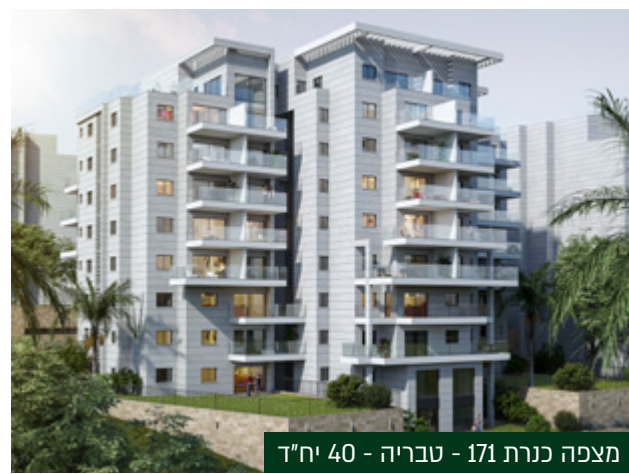
מצפה כנרת 171 - טבריה - 40 יח"ד