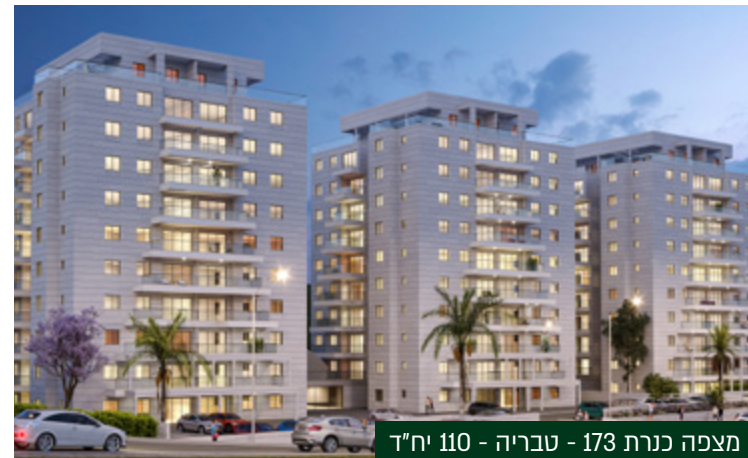
מצפה כנרת 173 - טבריה - 110 יח"ד