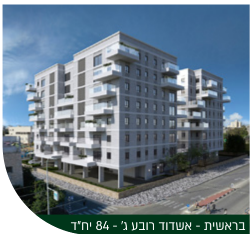
בראשית - אשדוד רובע ג' - 84 יח"ד