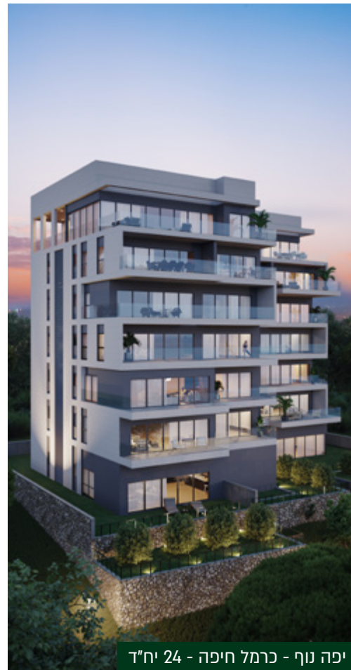
יפה נוף - כרמל חיפה - 24 יח"ד